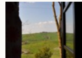
Blick ins Land

Alle Appartements sind mit Sat-TV, einem reservierten Parkplatz, einem eigenen Eingang und einer separaten Heizungsanlage ausgestattet. Heizung, Strom und Warmwasser sind im Preis enthalten. Die Küchen sind mit Spüle, Herd, Backofen, Filter, Dunstabzugshaube, Geschirrspüler und Kühlschrank mit Gefrierfach ausgestattet.