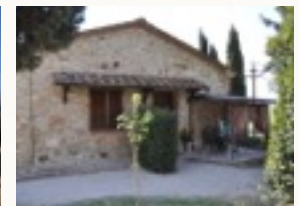
Einfach nur die Ruhe genießen