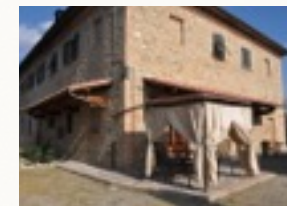
Neues Appartement im Haupthaus

Jedes Appartement verfügt über einen eigenen Eingang und einen eigenen großen Garten vor dem Haus, so dass jede Partei ihren eigenen Wohnbereich hat, der zudem noch durch Hecken sichtgeschützt ist. Die Wohnungen verfügen je nach Größe über 3 bis 6 Betten und sind mit Satelliten-TV und auch deutschsprachigen Sendern ausgestattet, einem eigenen Außengrill und - nicht zu vergessen - einem herrlichen Panoramablick auf die Hügel der Toskana.