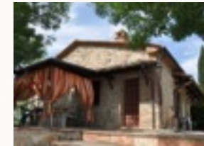
Freisitz mit Außengrill

Hier finden Sie einen kleinen Eindruck unserer im toskanischen Stil gestalteten Ferienwohnungen. Die Wohnungen wurden mit größter Liebe zum Detail renoviert, um die Atmosphäre des toskanischen Bauernhauses wieder herzustellen. Sie sind mit Terrakotta-Böden und antiken Möbeln ausgestattet.