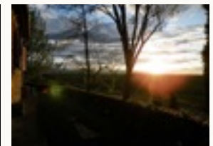
Abendstimmung im La Mirandola